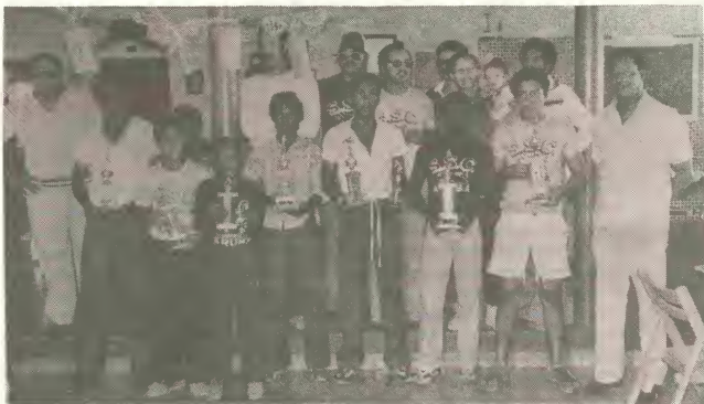
Deporte Escolar IDEFRE.